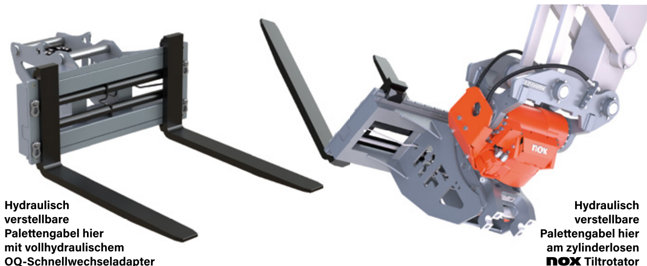
Hydraulisch verstellbare Palettengabel hier mit vollhydraulischem OQ-Schnellwechseladapter