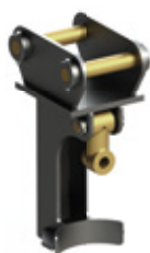
Aufhängung mit Auflage